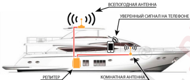
Схема №2. Пример установки системы усиления сотового сигнала на яхте.

Для наглядной проверки качества электромагнитной развязки проделайте следующую последовательность действий: