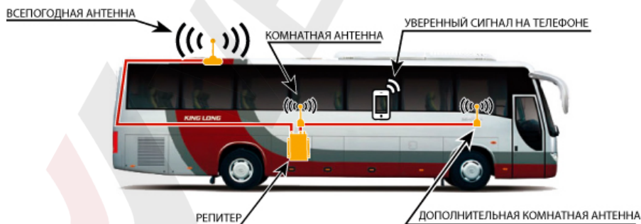
Схема №1. Пример установки репитера в автобусе.

Репитер представляет собой высокочувствительный двунаправленный СВЧ-усилитель сотового сигнала, поэтому при его установке нужно, чтобы всепогодная и комнатные антенны были хорошо изолированы друг от друга и не возникло самовозбуждения репитера. Чтобы на наглядном примере понять, что такое самовозбуждение, возьмите, к примеру, микрофон и громкоговоритель и поднесите их близко друг к другу – вы услышите очень сильный шум. Репитер будет работать бесперебойно только в том случае, если электромагнитная развязка будет достаточной для устойчивой работы системы усиления сотового сигнала.